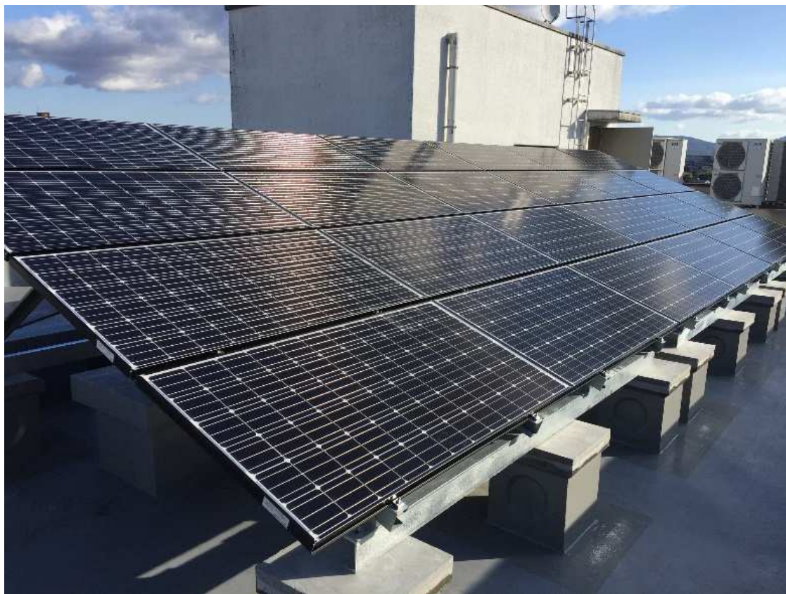
(瑞穂不動産社屋に設置した太陽光発電設備)

今後、テダソチマと東北電力ソーラーeチャージは、須賀川市内の宅地分譲地等における太陽光発電・蓄電システムの導入拡大を図ることで、地域におけるスマート社会の実現や社会の持続的発展に寄与するとともに、カーボンニュートラルに挑戦してまいります。